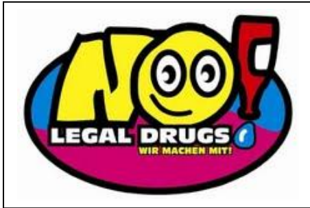
Abbildung 7: Logo des einstigen Präventionsprogramms NLD

Zu dieser Zeit hätten alle Bundesländer mehr oder weniger erfolgreich versucht, eigene Präventionsprogramme für Schulen zu gestalten und anzubieten. In den Jahren 2012 / 2013 sei es zu einem personellen Wechsel im Bereich des Bundeskriminalamtes, Büro 1.6 – Kriminalprävention gekommen. Damit einhergehend sei die Idee, österreichweit einheitliche und standardisierte Kriminalpräventionsprogramme zu entwickeln, aufgekommen. So wurde ein Team aus fünf Polizeibeamt*innen aus den unterschiedlichsten Bundesländern einberufen, um für den Bereich der Sucht(delikts)prävention ein bundesweit gültiges Präventionsprogramm zu entwickeln. Darunter waren drei Bedienstete, die den akademischen Lehrgang Sucht- und Gewaltprävention in pädagogischen Handlungsfeldern in Linz absolvierten, eine Bedienstete, die gerade nebenberuflich Soziale Arbeit studierte und ein Bediensteter der einen Uni-Lehrgang der Sigmund-Freud-Universität zum Thema Responsible Gaming sowie einen Lehrgang zur Suchtprävention vom Institut für Suchtprävention absolviert hat. Zusätzlich hätten alle fünf Beamt*innen eine mehrjährige Praxiserfahrung im Bereich der Sucht(delikts)prävention im schulischen Setting aufgewiesen.