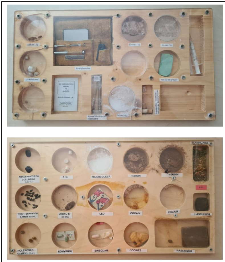
Abbildung 6: Fotos von 2 Drogenkoffer die im Bereich des LKA Wien in Verwendung waren

Ziel dieser abschreckenden Prävention sei es gewesen, den Konsum illegaler Stoffe zu verhindern. Dieser Gedanke sei schließlich von der neuen Strategie abgelöst worden, die den Konsum auf ein möglichst nicht schädliches Verhalten zu reduzieren versuche (vgl. I1: Z212–221).